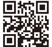
説明動画はこちら